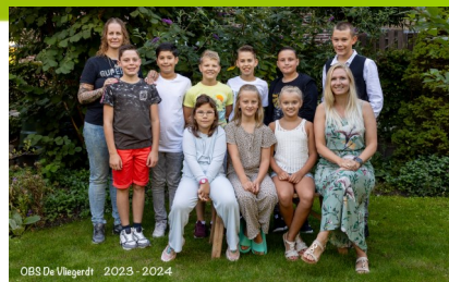
OBS De Vliegerdt 2023-2024