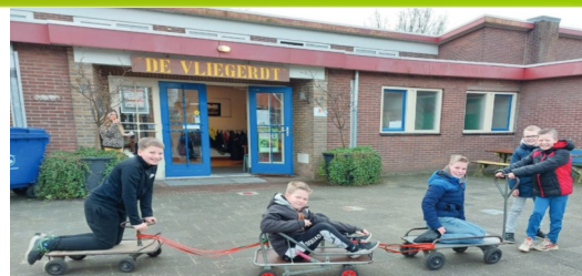
Een brede basis voor je toekomst

In deze nieuwsbrief kunt u lezen over fruit, inloop peuterspeelzaal, rapporten en oudergesprekken, onze nieuwe methode Kwink, wanneer de directie aanwezig is en wanneer de volgende nieuwsbrief verschijnt.